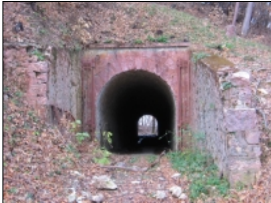
Quaix. Tunnel des batteries du Néron

Les batteries du Néron sont accessibles par un chemin militaire terminé par un tunnel pourvu d'abris à munition. Au-delà du tunnel sont disposés les aménagements d'artillerie et plus loin l'ancienne caserne.