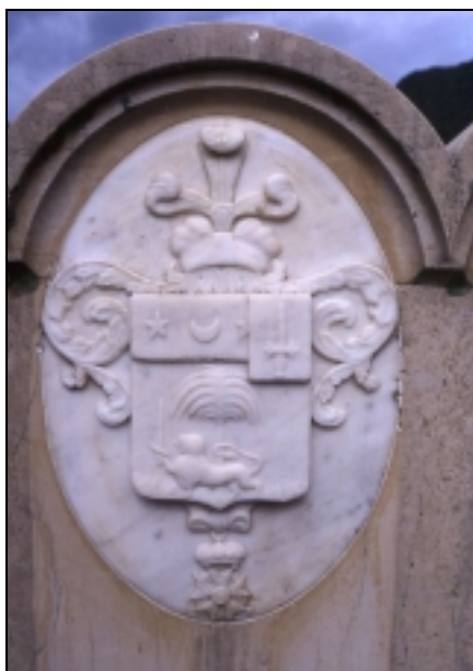
Quaix. Tombe du G l Brun (détail)

On peut également souligner la présence, à deux reprises, d'aménagements décoratifs en fer forgé, délimitant l'espace d'une tombe et accompagnés de croix en ferronnerie. Ce type d'élément, assez peu commun, mérite d'être relevé.