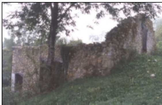
Quaix. Grange isolée ruinée, Maupertuis