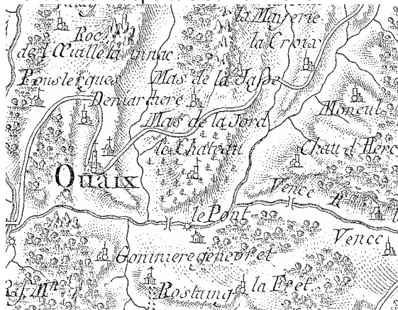
Quaix. Carte de Cassini

La carte de Cassini, établie entre 1744 et 1784, indique un hameau du nom de la Buissière à l'emplacement actuel du hameau de Valay, une gentilhommière du nom de Pouslergues au hameau actuel de l'Aujardière. L'Autre Côté de Vence s'appelait alors Goninière, et Peteset, Deniarrière. On peut être surpris de n'y trouver aucune mention de Maupertuis ou Fontvieille.