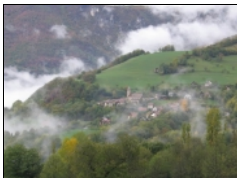
Quaix. Vue générale du village et du clocher